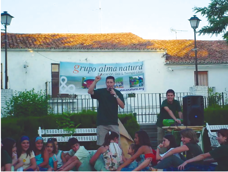
Figura 1.1. Dinamización social participativa (Santa Olalla del Cala).

AlmaNatura fue fulminante. En aquel tiempo, muy pocos hablaban de la importancia del mundo rural y sus servicios comenzaron a pasar inadvertidos entre los pequeños ayuntamientos a los que atendían.